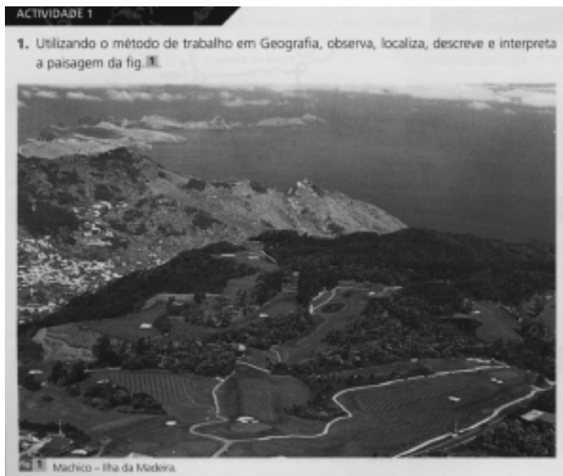
Figura 2 – Atividade prática sobre paisagens no manual escolar MP.

A atividade de um manual escolar português que escolhemos é a seguinte (figura 2):