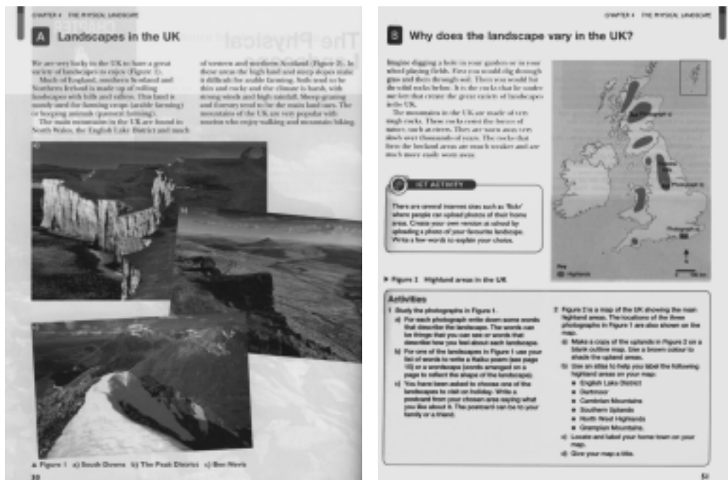
Figura 4 – Atividade prática sobre paisagens no manual escolar MUK.

A atividade de um manual escolar do Reino Unido que escolhemos é a seguinte (figura 4):