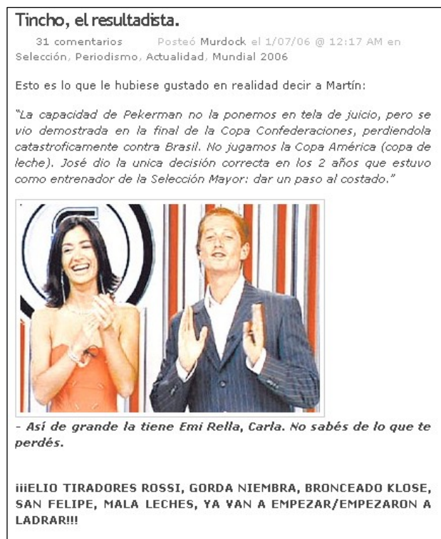
Figura 11. Crítica 4- La Redó! para periodistas argentinos de Fox Sports (1-07-06)