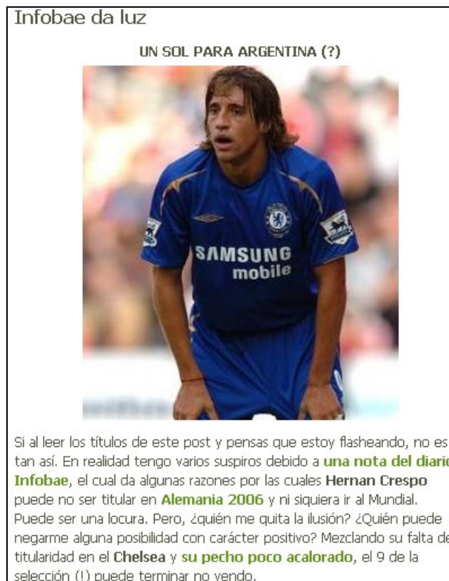
Figura 3. Simbiosis 1- Link de Vale Chumbar para Infobae (29-05-06).