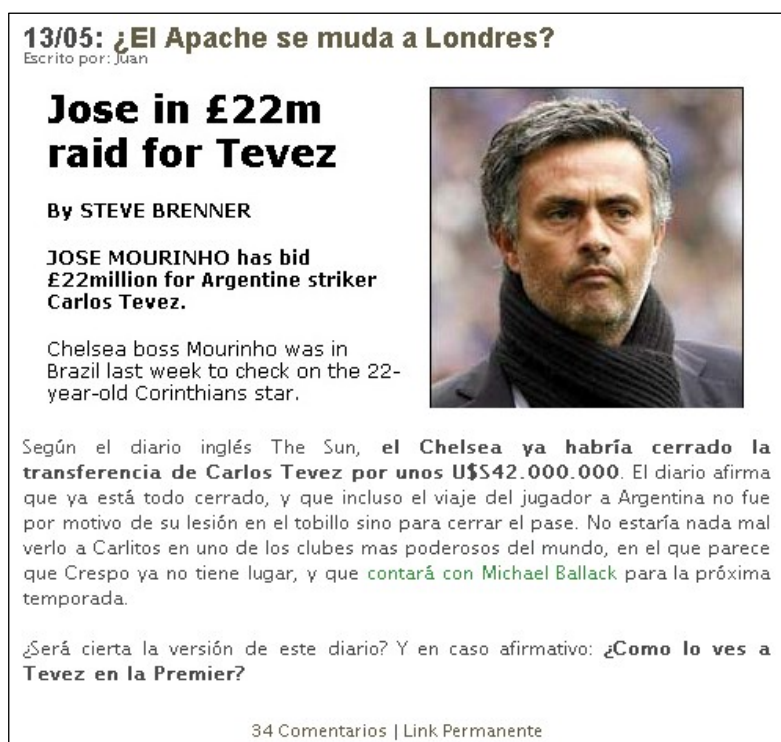
Figura 6. Simbiosis 4- Link de Vale Chumbar para The Sun (13-05-06)