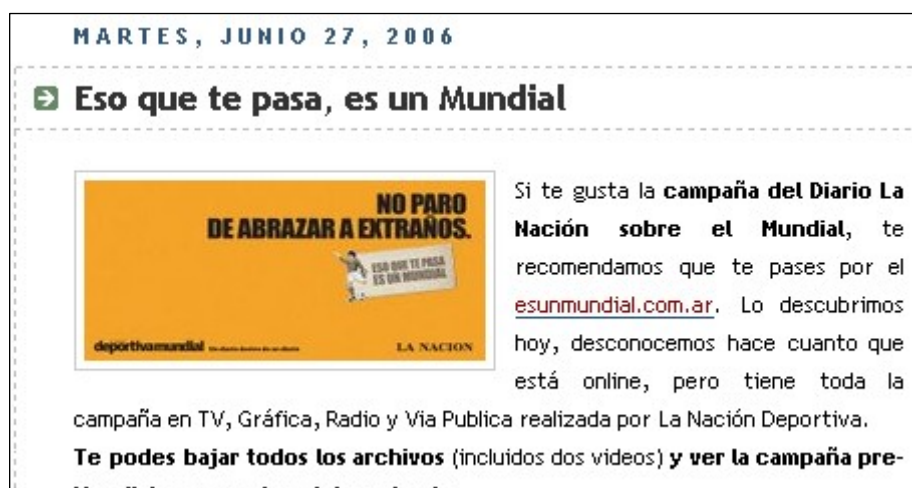
Figura 4. Simbiosis 2- Link de Tic Espor para Blog La Nación (27-06-06)