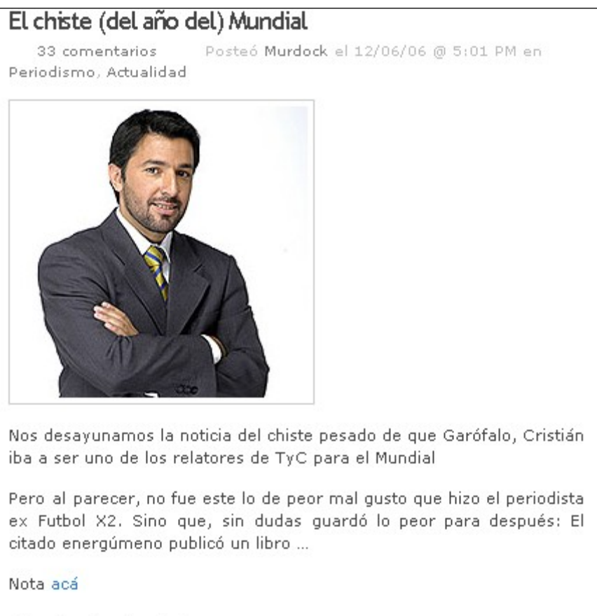
Figura 9. Crítica 2- La Redó! para periodista de T y C Sports(12-06-06)