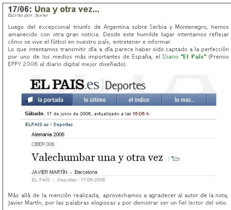
Figura 7. Simbiosis 5- Intercambio de links entre Vale Chumbar y El País da Espanha (17-06-06).